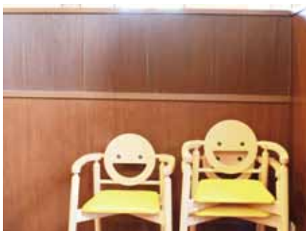
思わずニコリしてしまうキッズ用の椅子もご用意