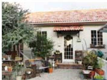
住宅外の奥に現れる赤い屋根が目印。かわいい外観に入る前からワクワク。