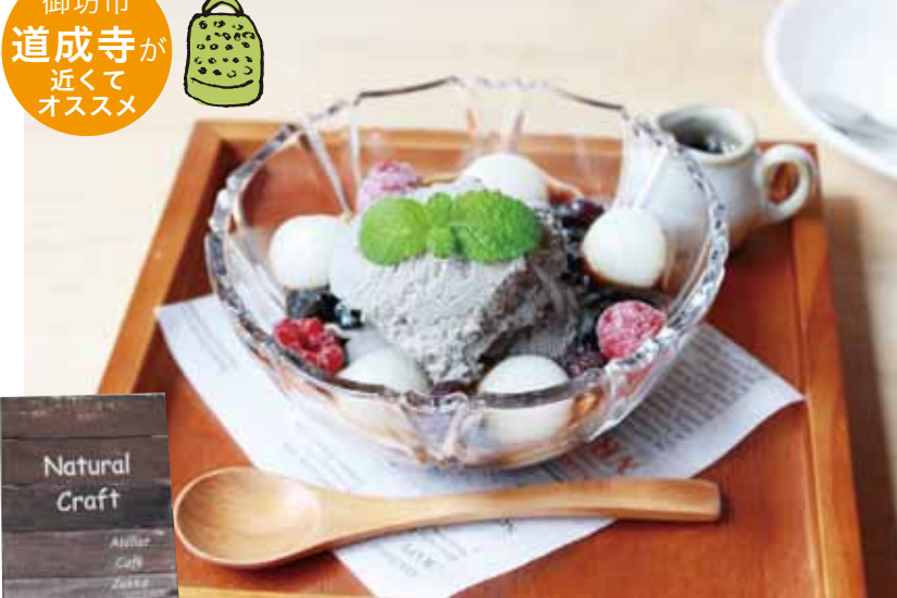
食べる直前に黒みつをかけて食べる人気スイーツ「和パフェ 380円」