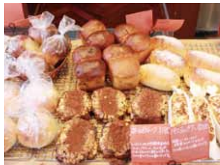
店頭に並ぶとすぐに売れていく焼きたてパン