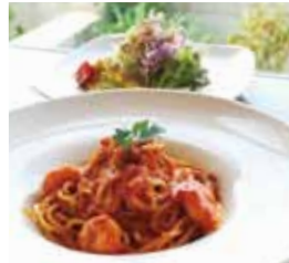
パスタは4種の味からチョイスできます。