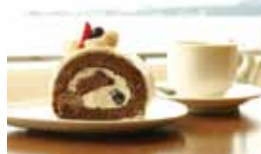
旬のフルーツや野菜を使ったケーキセットは700円。