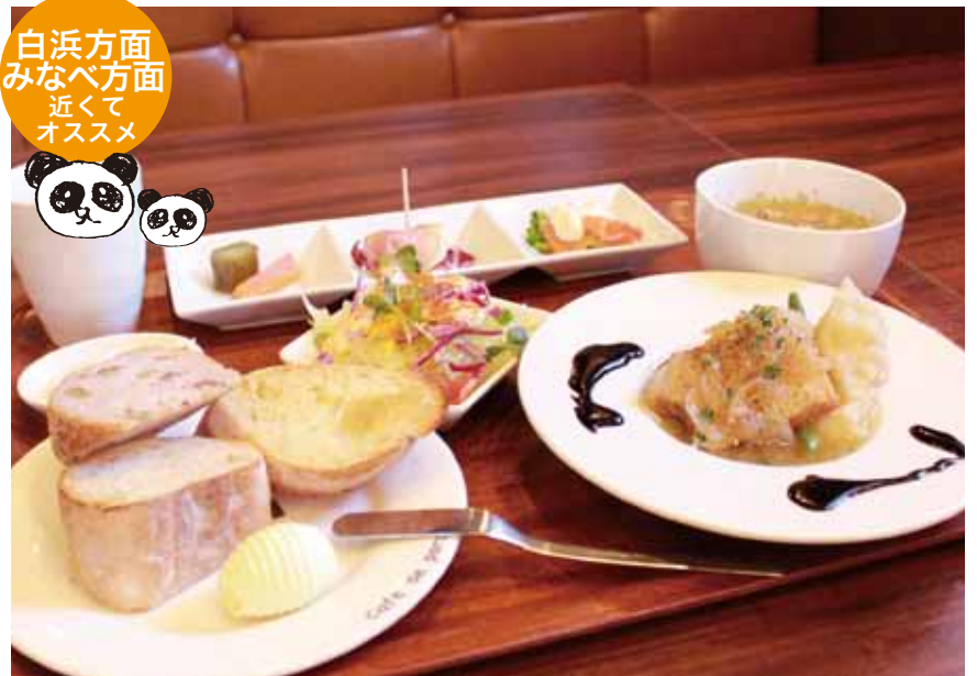
焼きたてパンorご飯が選べる(しかもお替わりOK!)大満足の日替わりランチは980円。