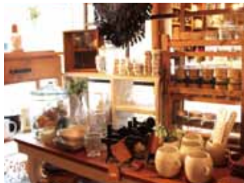
陶器や紅茶、キャンドル、ガラス雑貨...「かわいい!」がトコロ狭しと並んでいます。

住所: 和歌山県御坊市塩屋町北塩屋739-78 OPEN: 10:00~17:00 ランチ: 11:00~14:00 定休日: 水曜日・祝日 電話: 0738-23-9080 御坊・御坊南ICより約15分 道が分かりにくいので、迷ったらお電話を!