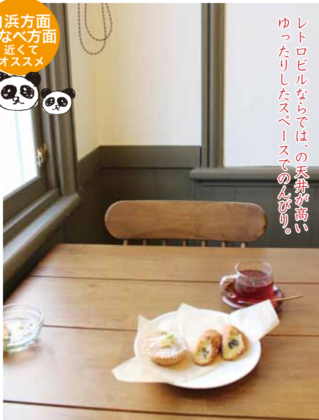
紀州産川添紅茶 400円、石釜焼いも 100円、りんごのファーブルトン 100円

2012年9月のオープンながら、地元ではリピーターが急増中！大正時代の建築様式で建てられた大きな窓が特徴のレトロビルは見ただけでもワクワクします。入口入ってすぐのパンコーナーには天然の海洋酵母でつくられたパンがずらり！どのパンもちもちで美味しく、旬の素材を使ったパンもたくさんあるので、どれにしようか迷ってしまう程。中でも塩麹食パンはもちもちで人気。窓際の席で外を眺めながらゆっくり時間を過ごせます。